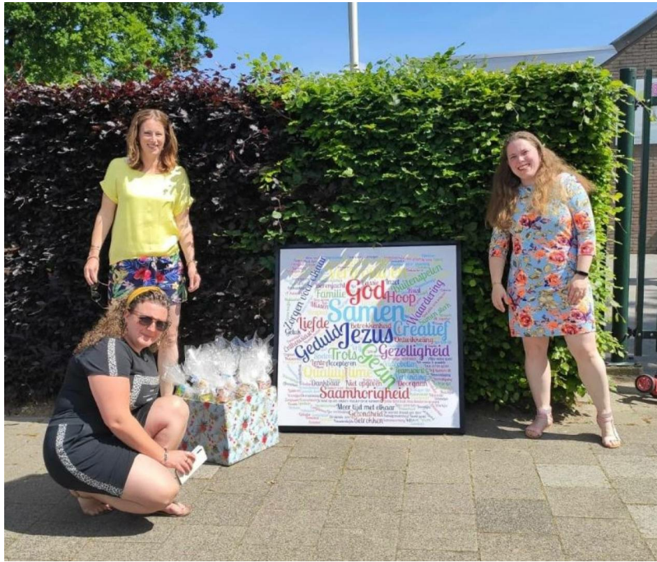
Cadeau van de ouders ontvangen n.a.v. de thuiswerkperiode

Van school uit proberen we u goed op de hoogte te houden van alle activiteiten die op school plaatsvinden. U kunt op vele manieren betrokken zijn bij de dagelijkse gang van zaken op school, bijvoorbeeld als hulpouder in de groep van uw kind of als lid van de ouderraad of van de medezeggenschapsraad. Uw hulp en betrokkenheid vinden wij heel waardevol!